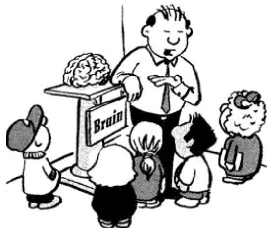
De evolutionistische leraar biologie:

"... het meest complexe arrangement van materie in het universum ... voortgebracht zonder het kleinste beetje intelligentie"