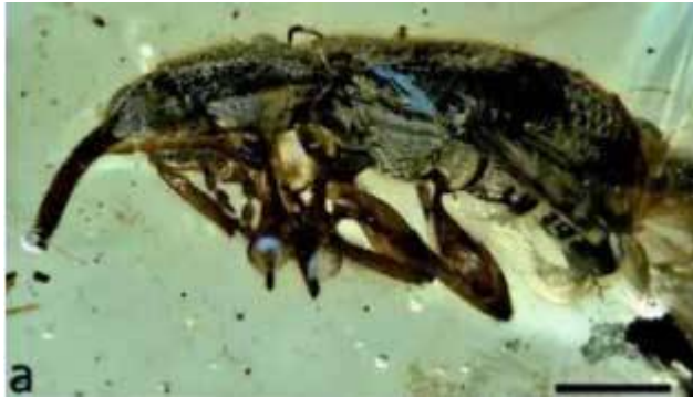
Voorbeeld van een insect in amber 6 [NL: barnsteen] van Myanmar, de Acalyptopygus brevicornis snuitkever.

“Nieuw onderzoek gepubliceerd... in Proceedings of the Royal Society B belicht tientallen barnsteenfossielen uit het Krijt-tijdperk die nog steeds bewijs bevatten van de oorspronkelijke kleuren van hun bewoner. Schitterend in metallic blauwe, paarse en groene kleuren, zijn deze oude insecten zowel vreemd als vertrouwd”. [5]