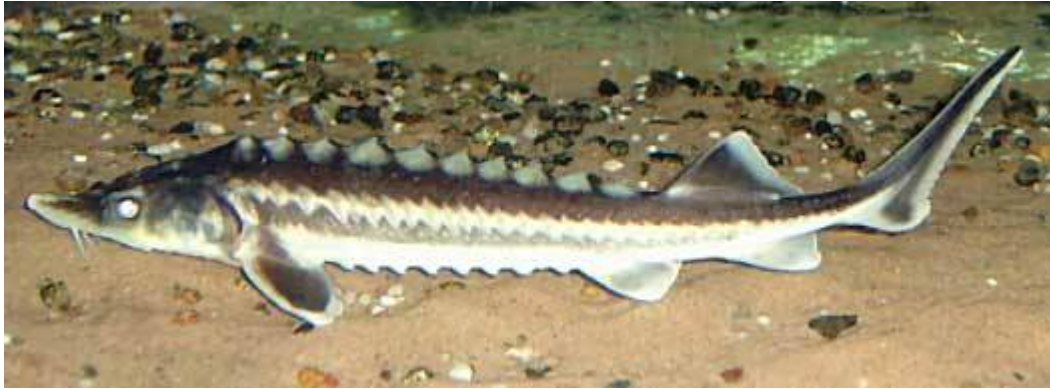
Russische Steur (Sturgeon)

wetenschappelijke onzin (zie bijvoorbeeld de verrassende ‘belwhal’ 7 Viswetenschappers waren onlangs verbaasd over de onwaarschijnlijke kruising van twee zeer verschillende soorten: