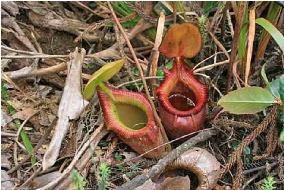
Deze carnivore (bekerval) plant is niet in staat om zich te ontwikkelen naar insecten toe