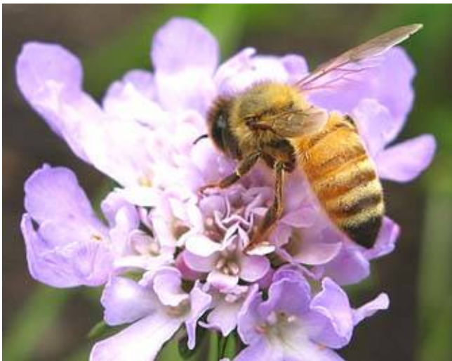
Symbiose van Bij ↔ Bloem

De term komt uit het Grieks: συν: samen + βίωσις: levend. Het is het samenleven van twee (of meer, maar algemeen gelimiteerd tot twee) levensvormen. De beide partners heten symbionten . De grootste partner wordt ook wel gastheer genoemd. Symbiose kan opgedeeld worden in twee types. Het ene type is ectosymbiose , waarbij de organismen aan elkaars buitenkant leven. Het andere type is endosymbiose , waarbij een organisme binnenin een groter organisme leeft.