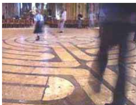
Kathedraal van Chartres

Andere scholen met labyrinten zijn: Eastern University, Lutheran Theological Seminary in Philadelphia, San Francisco Theological Seminary, Louisville Presbyterian Theological Seminary, Columbia Theological Seminary in Decatur, Georgia, Lutheran Theological Southern Seminary, Lancaster Theological Seminary, Northwestern University, Manchester College, Eden Seminary, Phillips Theological Seminary in Tulsa, Oklahoma, en Abilene Christian University.