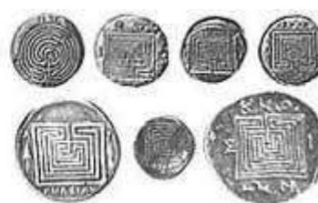
Diverse labyrinten – rechts: op munten uit Kreta