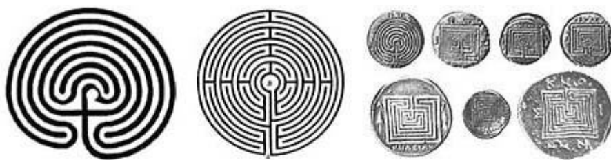
Diverse labyrinten - rechts: op munten uit Kreta