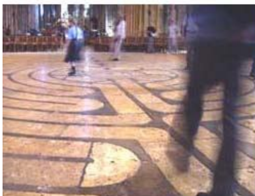
Het labyrinth in de kathedraal van Chartres