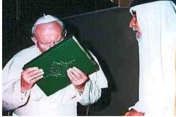
De paus kust de Koran, in mei 1999

Alle Schriftaanhalingen komen uit de Statenvertaling 1977. Vertaling, plaatjes en voetnoten door M.V. Update 29-05-2017 (aanvulling + herstel links)