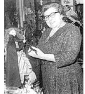
Sybil Leek 8 1923 - 1983

Ik zou het ene voorbeeld na het andere kunnen geven van de OCCULTE connectie met reflexologie en de andere in onderling verband staande methoden. Maar ik zal besluiten met slechts één bijkomend voorbeeld, van een welbekende HEKS: Sybil Leek. Zij wordt “de meesteres van het OCCULTE” genoemd en verklaart dat het Taoïsme - een op het occulte gebaseerde Chinese religie - sterk leunt op de yin-yang theorie. Zij zegt ook dat de yin-yang theorie “een idee [is] dat zulke dingen inspireerde als Chinees boksen, adembeheersing [toegepast in yoga, meditatie, enz.], het gebruik van bijzondere kruiden, en sommige eerder exotische seksuele oefeningen die ontwikkeld werden op de Yang met de Yin te voeden”.