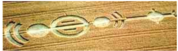
Links: maquette van de ambassade Rechts: deze graancirkels stonden model

Niettegenstaande de bizarre boodschap van Raël heeft de Raëliaanse Religie een grote aanhang gekregen vanaf haar ontstaan in 1973, toen Raël de zogenoemde buitenaardse ontmoetingen had. Zijn beweging had in 1997 35.000 volgelingen in 85 landen ( New York Times , August 12, 1997, p. A6), en zijn boek The Message Given to Me By Extra-Terrestrials (2) werd vertaald in 22 talen (PRNewswire, 21 mei 1997).