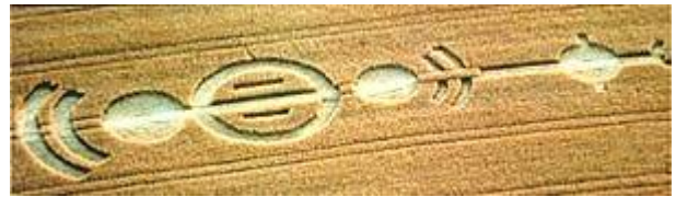
Links: maquette van de ambassade Rechts: deze graancirkels stonden model

Niettegenstaande de bizarre boodschap van Raël heeft de Raëliaanse Religie een grote aanhang gekregen vanaf haar ontstaan in 1973, toen Raël de zogenoemde buitenaardse ontmoetingen had. Zijn beweging had in 1997 35.000 volgelingen in 85 landen ( New York Times , August 12, 1997, p. A6), en zijn boek The Message Given to Me By Extra-Terrestrials (2) werd vertaald in 22 talen (PRNewswire, 21 mei 1997).