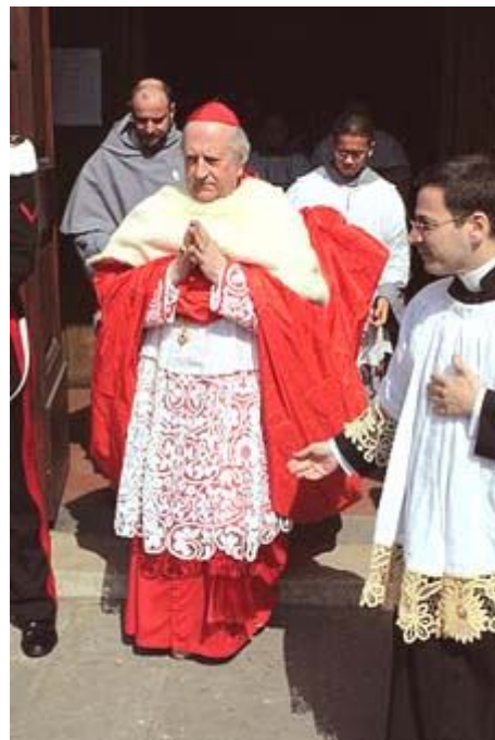
Rechts: kardinaal met “cappa magna”

verhoevenmarc@skynet.be - www.verhoevenmarc.be - www.verhoevenmarc.be/NieuwsteArtikelen.htm