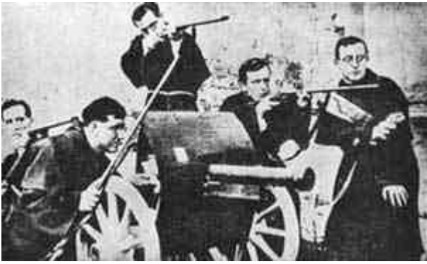
7. Katholieke “evangelisatie” gedurende de Spaanse Burgeroorlog (17 juli 1936 tot 1 april 1939).