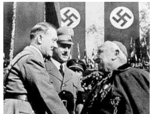
10. Hitler Groet een katholieke kardinaal.