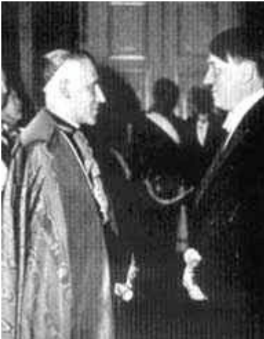
8. Hitler met aartsbisschop Cesare Orsenigo, de pauselijke nuntius in Berlijn.

Op 20 april 1939, vierde Orsenigo Hitlers verjaardag. De huldigen, ingewijd door Pacelli (paus Pius XII) werd een traditie. Elke 20 april, moest kardinaal Bertram van Berlijn de “warmste gelukwensen” overbrengen aan de Fuhrer in de naam van de bisschoppen en de dioceses in Duitsland, met de “vurige gebeden die de Katholiken van Duitsland naar de hemel zenden op hun altaren”. Zie