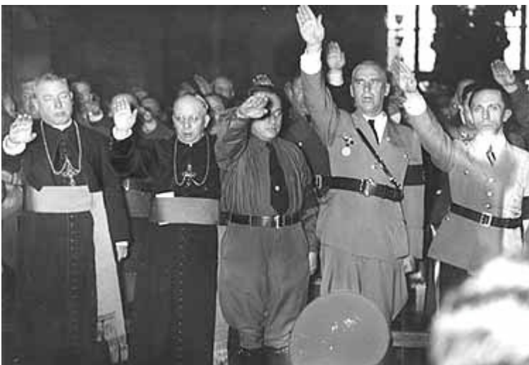
11. Katholieke bisschoppen brengen de Nazigroet ter ere van Hitler.

Rechts op de foto ziet u propagandachef Goebbels.