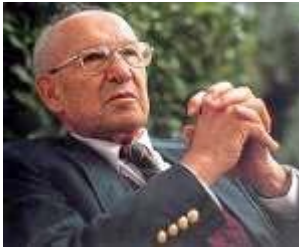
Peter F. Drucker