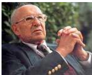
Peter F. Drucker

Alle Schriftaanhalingen komen uit de Statenvertaling (1977 of HSV) Vertaling, plaatjes en voetnoten door M.V.