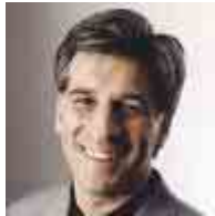
Steve Chalke 2