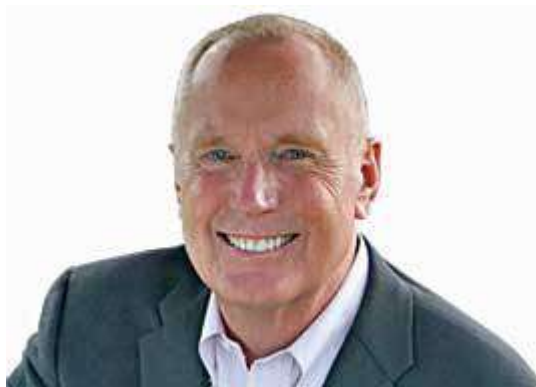
Max Lucado met rechts slechts een kleine greep uit zijn boeken voor volwassenen. Hij schreef ook tal van boeken voor kinderen