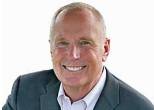
Max Lucado met rechts slechts een kleine greep uit zijn boeken voor volwassenen. Hij schreef ook tal van boeken voor kinderen