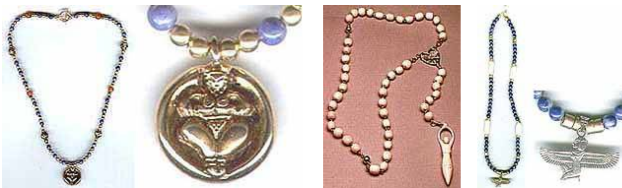
‘Paternosters’ in de godin-aanbidding

De geloofwaardigheid van de godin-aanbidding heeft een vlucht genomen door de acceptatie ervan door professoren en haar opname in leerboeken. Wicca-doctrines worden gepromoot met publiciteitsfondsen van erkende colleges en universiteiten. [16]