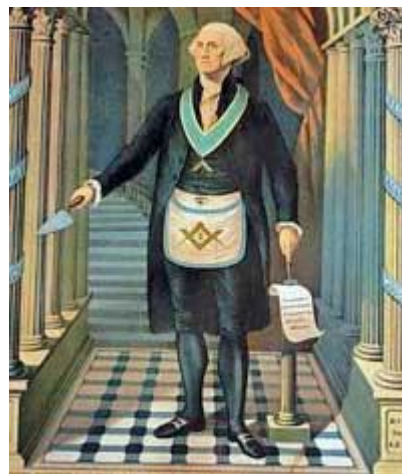
George Washington als vrijmetselaar

Samenvatting: 11 vrijmetselaars, 3 mogelijke vrijmetselaars, 1 humanist, 2 verdedigers van vrijmetselarij, 4 geen bewijs van connecties.