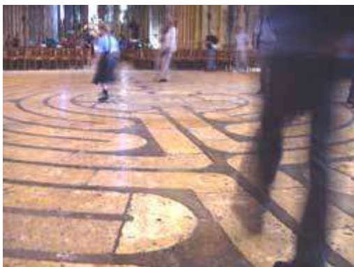
Het labyrint in de kathedraal van Chartres