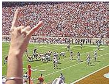
De wereld toont wie haar god is

“Van hen, de ongelovigen, geldt dat de god van deze eeuw [Gr. aioon ] hun gedachten heeft verblind, opdat de verlichting met het Evangelie van de heerlijkheid van Christus” (2 Korinthiërs 4:4).