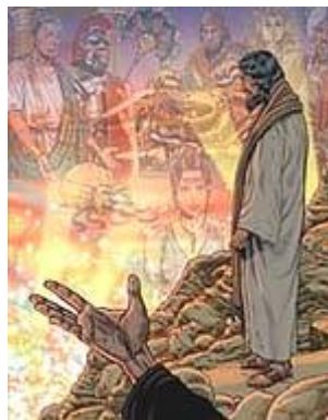
Satans macht over de wereld

“En daarna bracht de duivel Hem op een hoge berg en liet Hem in een ogenblik tijd al de koninkrijken van de wereld [Gr. oikumene ] zien. En de duivel zei tegen Hem: Ik zal U al deze macht en de heerlijkheid van deze koninkrijken geven, want die is aan mij overgegeven en ik geef die aan wie ik maar wil; dus, als U mij zult aanbidden, zal het allemaal van U zijn” (Lukas 4:5-7).