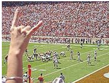
De wereld toont wie haar god is

“Van hen, de ongelovigen, geldt dat de god van deze eeuw [Gr. aioon ] hun gedachten heeft verblind, opdat de verlichting met het Evangelie van de heerlijkheid van Christus” (2 Korinthiërs 4:4).