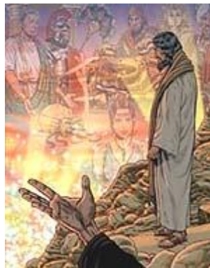
Satans macht over de wereld

“En daarna bracht de duivel Hem op een hoge berg en liet Hem in een ogenblik tijd al de koninkrijken van de wereld [Gr. oikumene ] zien. En de duivel zei tegen Hem: Ik zal U al deze macht en de heerlijkheid van deze koninkrijken geven, want die is aan mij overgegeven en ik geef die aan wie ik maar wil; dus, als U mij zult aanbidden, zal het allemaal van U zijn” (Lukas 4:5-7).