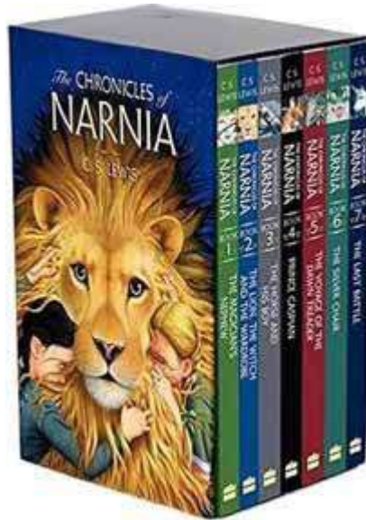
De 7-delige Kronieken van Narnia

Alle Schriftaanhalingen komen uit de Statenvertaling (HSV) Vertaling, plaatjes en voetnoten door M.V.