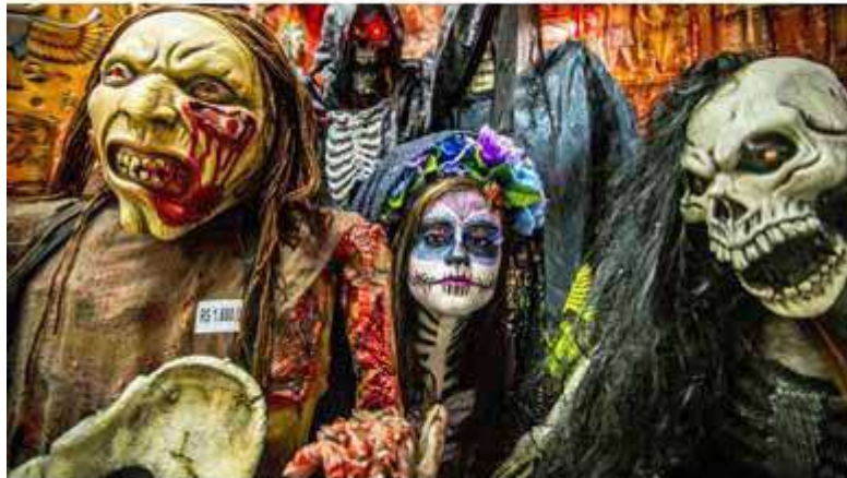
Doet u hieraan mee? De hel verwacht u!