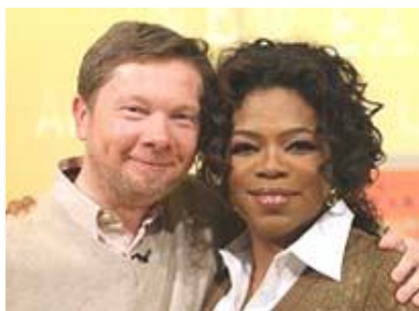
Eckhart Tolle & Oprah Winfrey

propagandist Oprah Winfrey. Maar ik wil in dit artikel de volgende vraag behandelen: “Leert de Bijbel ook maar ergens dat de mens God is?”