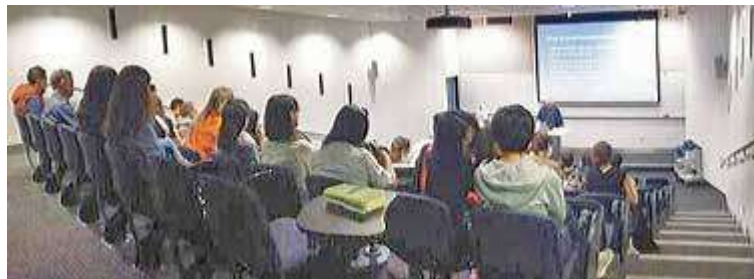
Studenten aan de Universiteit van Adelaide, Zuid-Australië, op een voordracht door de auteur