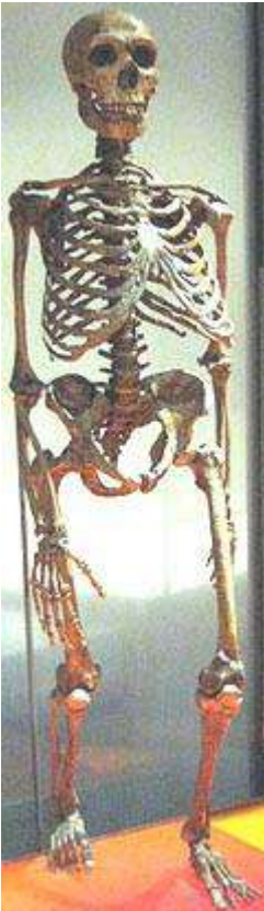
De Neanderthaler : in alle opzichten een mens

In een poging om de kloof te dichten tussen apen en mensen, werden sommige fossiele mensen verklaard “aapachtig” te zijn en dus voorouderlijk van de “moderne” mens. Je zou kunnen zeggen dat deze poging een “aap” uit een mens zoekt te maken. Menselijke fossielen waarvan men beweert dat ze “aapmensen” zijn, worden meestal geclassificeerd onder het genus Homo 3 . Hierin zijn begrepen Homo erectus , Homo heidelbergensis en Homo neanderthalensis .