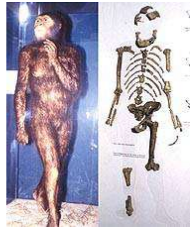
Lucy: mens uit aap

Het best gekende specimen van Australopithecus afarensis is het fossiel dat algemeen gekend is als “Lucy” [zie rechts een reconstructie op basis van gevonden fragmenten]. Een gelijkende pop van “Lucy” in de Living World tentoonstelling in de St. Louis Zoo toont een harig mensachtig vrouwelijk lichaam met menselijke handen en voeten maar met een duidelijk aapachtig hoofd. De drie voet ( \pm 90 cm) grote Lucy staat rechtop in een diep peinzende pose met haar vinger gekromd onder haar kin, haar ogen staren weg in de verte alsof zij aan het denken was met het verstand van Newton.