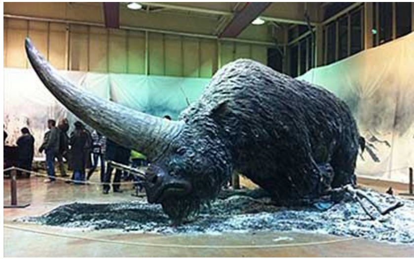
De Siberische Eenhoorn (reconstructie). Zie https://nl.wikipedia.org/wiki/Siberische_eenhoorn

Plinius de Oudere, in de eerste eeuw n.C., beschrijft “een buitengewoon wild beest, genaamd Monoceros (een-hoornig) ... Het maakt een diep-loeiend geluid, en één zwarte hoorn van twee el lang staat in het midden op zijn voorhoofd. Dit dier, zo zegt men, kan niet levend gevangen worden”.