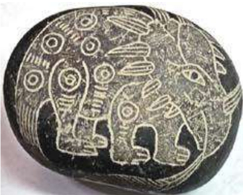
Styracosaurus op ICA-steen. Zie:

Eenhoorn betekent letterlijk “eenhoornig” en het was een dier met één enkele hoorn. De Webster Dictionary , van 1828, definieert de eenhoorn als “een dier met één hoorn; de monoceros 8 . Deze naam wordt dikwijls toegepast op de neushoorn”. Er werden fossielen gevonden van een gigantisch eenhoornig beest of dinosauriër 9 en deze zijn ondergebracht in museums. Ook hebben we de eenhoornige vogel, eenhoornige vis 10 , eenhoornige nachtvlinder, eenhoornige kever 11 , enz.