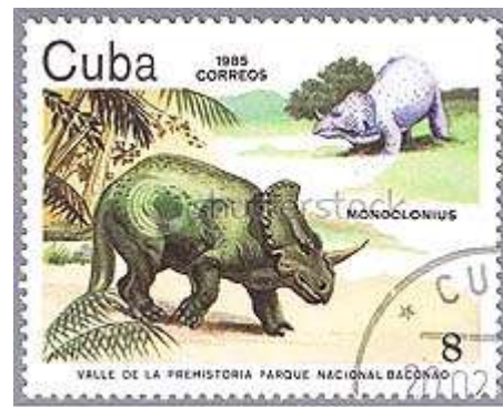
Monoclonius op postzegel