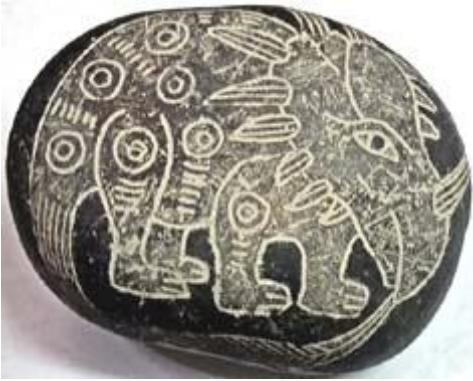
Styracosaurus op Ica-steen (volg de link)

hoornige vogel, eenhoornige vis 10 , eenhoornige nachtvlinder, eenhoornige kever 11 , eenhoornige schelp, enz.