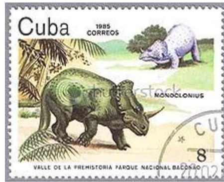
Monoclonius op postzegel