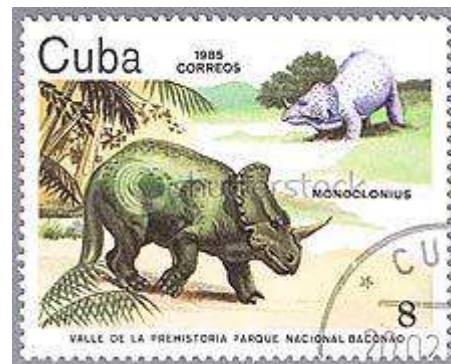
Monoclonius op postzegel