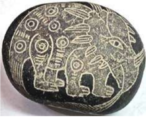
Styraeosaurus op Ica-steen (volg de link)

hoornige vogel, eenhoornige vis 10 , eenhoornige nachtvlinder, eenhoornige kever 11 , eenhoornige schelp, enz.