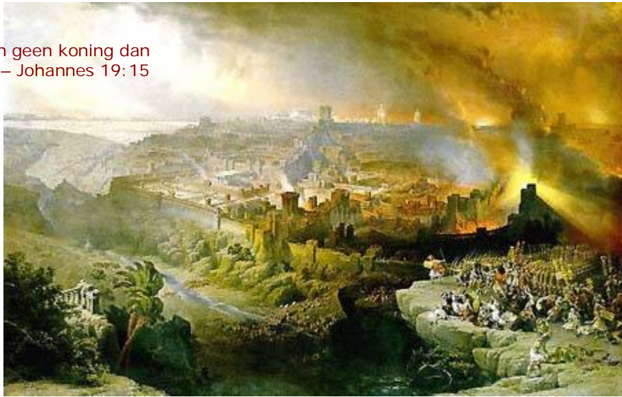
Met de verwoesting van Jeruzalem in 70 n.C. kwam een eind aan de natie Israël

“Wij hebben geen koning dan de keizer!” – Johannes 19:15