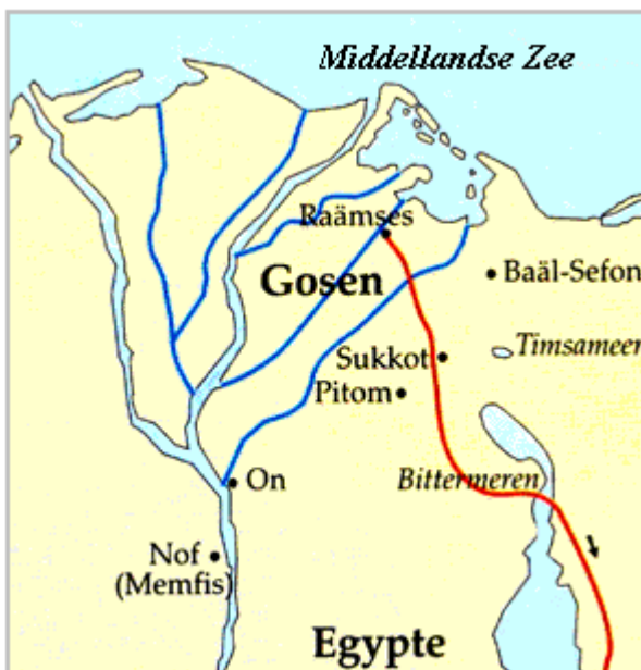
Raämses, Pitom en de route van de uittocht (rood)

Na jaren van ontbering en lijden, zuchtten en schreeuwden de kinderen Israëls over de dienst; en hun hulpgeroep kwam op tot God ( Exodus 2:23-25 , Handelingen 7:34). God was de Enige die hen kon BEVRIJDEN van de slavernij.