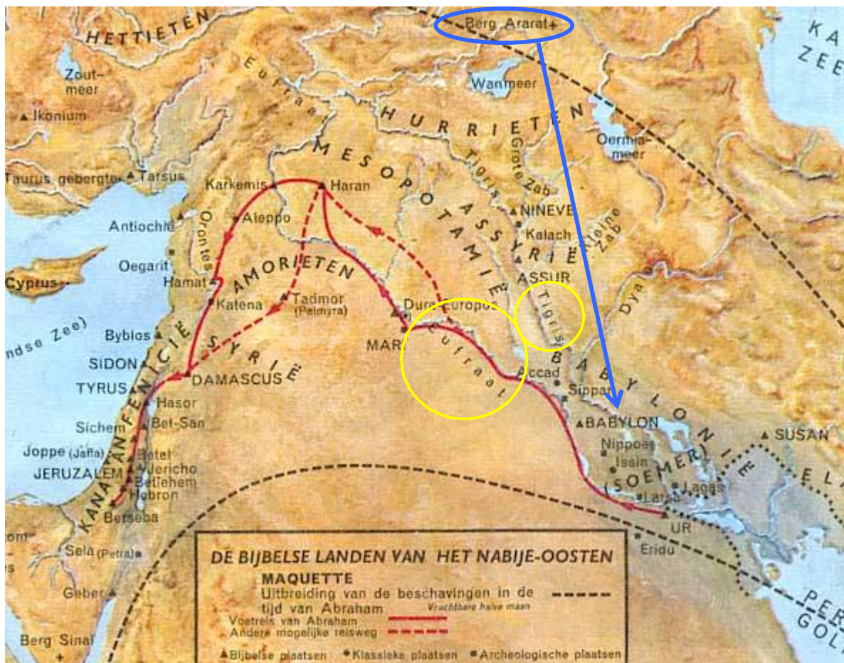
Noach reisde met zijn familie van Ararat naar Sinear (of Soemer/Sumerië; blauwe pijl), waar later Babylon en zijn toren werden gebouwd tussen de twee stromen Tigris en Eufraat (geel omcirkeld).

Noachs familie begon zich voort te planten. Noachs zonen hadden kinderen. Deze kinderen hadden zondige harten, net zoals hun ouders. Noach had vele kleinkinderen, en vele achterkleinkinderen. Als de jaren voorbijgingen was het aantal van 8 oorspronkelijke overlevenden vermenigvuldigd tot duizenden mensen. Deze mensen bleven bij elkaar en reisden van Ararat (Genesis 8:4), waar de ark kwam te rusten, naar het land van Sinear (= Sumerië of Soemer, Genesis 11:2) dat gelegen was in een grote vlakte tussen twee grote stromen (Tigris en Eufraat), een van de vruchtbaarste gebieden in de wereld, en ze maakten die plaats tot hun thuis: