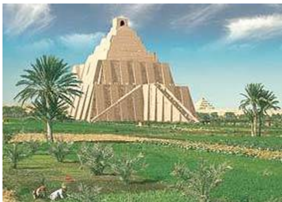
Zo moest de Toren van Babel er ongeveer uitzien

waaruit zijn bakstenen konden maken, en ook asfalt (bitumen) dat gebruikt kon worden als mortel. Gewone bakstenen werden gedroogd in de zon, maar ditmaal werden ze goed gebakken opdat ze harder zouden zijn, zoals natuursteen (Genesis 11:3).