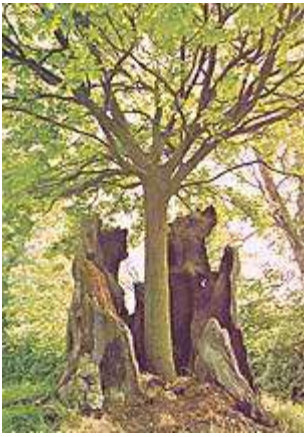
Leven uit de dood

CHARISMATISCHE DWALINGEN OVER GROEI - De hierboven gegeven schriftuurlijke principes zijn afwezig in de hedendaagse charismatische beweging. Men vindt daar niet de wil om te groeien op het grondig werkende (trage) tempo van de Geest, noch dat dit moet ontvangen worden in Zijn proces van leven uit dood. Hun blik is gericht op een spectaculaire ervaring, en het moet direct ontvangen worden, hier en nu! Als de ene ervaring gedaan is, moet er een andere opgewerkt worden. Naar het altaar! En dat gaat zo maar door, in kringen blijven draaien en draaien, maar altijd erin falen enige groei te ontwikkelen, “groei in de genade en kennis van onze Heere en Zaligmaker Jezus Christus” (2 Petrus 3:18).