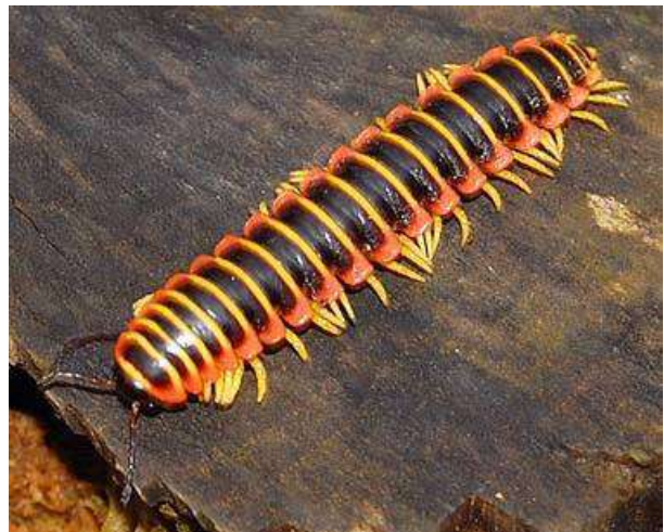
Apheloria Virginiana 1

Maar er bestaat een soort van duizendpoot, met de naam Apheloria , die dit gewoon doet. Apheloria heeft, op elk segment van zijn lichaam, speciale klieren die een chemische stof produceren die nodig is als afweersysteem. Wanneer de duizendpoot door een vijand wordt aangevallen, dan mixt hij deze chemische stof met een katalysator. Het resultaat is een samenstelling die bestaat uit milde irritantia plus waterstofcyanidegas: dezelfde dodelijke chemische stof die in de gaskamer wordt gebruikt. Bij dit afweersysteem zullen zowel de duizendpoot als zijn vijanden gehuld worden in een wolk van dodelijk cyanidegas. Zijn aanvaller sterft, maar de duizendpoot wandelt gewoon weg, zonder enig letsel.