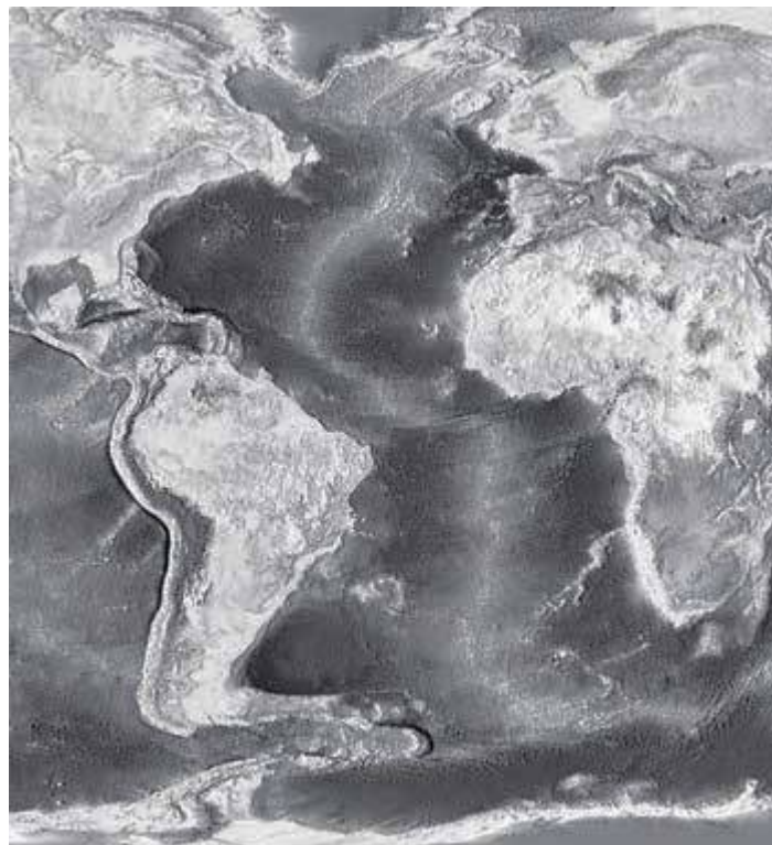
Figuur 1. De Mid-Atlantische Rug ondersteunt sterk het concept van de platenbeweging