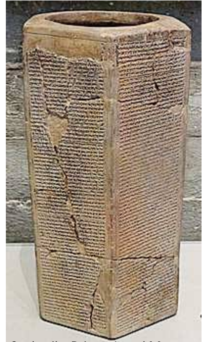
Sanheribs Prisma Israel Museum

Laat me beginnen met te zeggen hoe ik ervan houd dat deze organisatie (Creation Ministries International) argumenten weerlegt van sceptici tegen de Bijbel, schepping, het boek Genesis, enz. Deze organisatie heeft aangetoond hoe waar Gods Woord is en geen sprookje van enige soort. Wat ik zou willen weten is of de archeologie de Bijbel in enige zin heeft tegengesproken of weerlegt zoals beweerd door atheïsten/sceptici, waarvan velen zover gaan als te beweren dat Salomo, Abraham, Mozes en zelfs de Schepper Jezus Christus, nooit hebben bestaan, of zelfs dat de Toren van Babel en de Exodus niet waarachtig zijn. Ik weet dat dit alles waar is omdat de Bijbel niet liegt en altijd weer heeft bewezen waar te zijn, maar mijn punt is of er bewijzen bestaan (buiten de Bijbel) in de archeologie die steun geven aan het bestaan van figuren en gebeurtenissen die in de Bijbel vermeld worden?