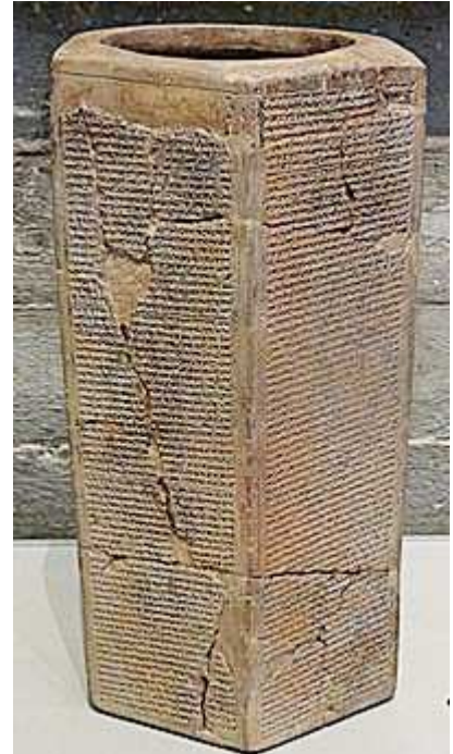
Sanheribs Prisma Israel Museum

Laat me beginnen met te zeggen hoe ik ervan houd dat deze organisatie (Creation Ministries International) argumenten weerlegt van sceptici tegen de Bijbel, schepping, het boek Genesis, enz. Deze organisatie heeft aangetoond hoe waar Gods Woord is en geen sprookje van enige soort. Wat ik zou willen weten is of de archeologie de Bijbel in enige zin heeft tegengesproken of weerlegt zoals beweerd door atheïsten/sceptici, waarvan velen zover gaan als te beweren dat Salomo, Abraham, Mozes en zelfs de Schepper Jezus Christus, nooit hebben bestaan, of zelfs dat de Toren van Babel en de Exodus niet waarachtig zijn. Ik weet dat dit alles waar is omdat de Bijbel niet liegt en altijd weer heeft bewezen waar te zijn, maar mijn punt is of er bewijzen bestaan (buiten de Bijbel) in de archeologie die steun geven aan het bestaan van figuren en gebeurtenissen die in de Bijbel vermeld worden?