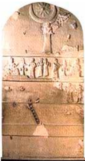
Stèle van Ur-Nammu

In het oude Syrië en Kanaän werd de maangod Sin gewoonlijk afgebeeld door de maan in zijn eerste fase. Soms werd de volle maan binnen de maansikkel geplaatst om alle fazen van de maan te benadrukken. De sterren waren de dochters van Sin. Zo was bvb. Ishtar de dochter van Sin. Offers aan de maangod worden beschreven in de Pas Shamra teksten. In de Ugaritische teksten wordt de maangod soms Kusuh genoemd. In Perzië, zowel als in Egypte, wordt de maangod afgebeeld op muurschilderingen en op de hoofden van beelden. Hij was de Rechter van mensen en goden. Het Oude Testament berispt voortdurend tegen de aanbedding van o.a. de maangod (zie: Deut 4:19; 17:3; 2 Kon 21:3,5; 23:5; Jer 8:2; 19:13; Zef 1:5, enz.). Eigenlijk kan overal in de oude wereld het symbool van de maansikkel gevonden worden op zegelindrukken, stèles, aardewerk, amuletten, kleitabletten, cilinders, gewichten, oorkingen, halsnoeren, muren, enz. In Tell-el-Obeid werd er een koperen kalf gevonden met een maansikkel op zijn voorhoofd. Een afgod met het lichaam van een stier en het hoofd van een man heeft een maansikkel-inleg van schelpen op zijn voorhoofd.