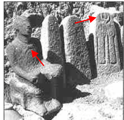
Tempel van de maangod in Hazor, met maansikkel op de borst en op de stèle

In Ur werd een tempel van de maangod opgegraven door Sir Leonard Woolley. Vele voorbeelden van maanaanbedding werden opgegraven en die zijn ondergebracht in het Brits Museum tot op vandaag. Ook Haran (of Harran) stond bekend voor zijn aanbedding van de maangod.