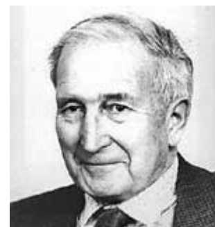
De notoire atheïst die zijn mening veranderde, Antony Flew

"Hij lijkt me nu zo dat de bevindingen van meer dan vijftig jaar van DNA-onderzoek hebben voorzien in stof voor een nieuw en enorm krachtig argument voor design".[11]