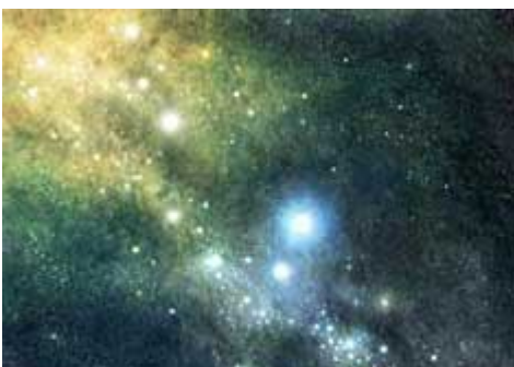
De Bijbel zegt ons dat God de sterren maakte op de vierde dag van de scheppingsweek

Volgens de big bang – ‘the only game in town’ om de oorsprong van de sterren te verklaren – moeten er twee fases van sterrenformatie geweest zijn. Fase 1 betrof de formatie van waterstof/helium sterren (die Populatie III sterren [7] genoemd worden). Hier is het eerste probleem: hoe krijg je gas gevormd in een snel expanderend primordiaal universum om samen te smelten om zo een kritische massa te vormen opdat er genoeg gravitatie is om meer gas aan te trekken om te groeien tot een ster? Gassen neigen er niet toe om samen te komen; ze verspreiden zich, in het bijzonder daar waar er een grote hoeveelheid energie (hitte) is.[8] Kosmologen vonden ‘donkere materie’ uit, wat een onzichtbare, niet te detecteren ‘materiaal’ is dat gewoon veel gravitationele aantrekkingskracht genereert, precies waar het nodig is. Nog meer magie![9]