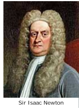
Sir Isaac Newton

De realiteit is echter tegen deze percepties. Isaac Newton (plaatje rechts), zowat de grootste wetenschappelijke geest aller tijden, was een gelovige, net zoals andere stichters van de moderne wetenschap. Onderzoekingen hebben consistent aangetoond dat mensen met een sterke aanclinging aan het gezag van de Bijbel het minst bijgelovig zijn, in tegenstelling tot de gemiddelde de facto -atheïst.[1] Inderdaad, één atheïst drukte zijn teleurstelling uit dat “sommige van de hoogst intelligente en geïnformeerde mensen” die hij kende christenen waren.[2]