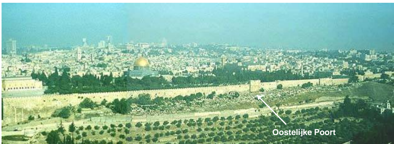
De Oostelijke Muur vandaag, met de Rotskoepel of Omarmoskee. Toen de bouw van de Rotskoepel begon, in 685, stond op die plek een door kalief Omar gebouwde kleine houten moskee.

In augustus 1967 waarschuwde het Opperste Rabbinaat van Israël de Joden “van niet enig gedeelte van de Tempelberg binnen te gaan”. Het volgende bord staat nog steeds bij de ingang van de Tempelberg op gezag van de leidende rabbi's: “AANDACHT EN WAARSCHUWING: Het gebied van de Tempelberg binnengaan is verboden door de Joodse Wet gezien de heiligheid van de plaats”. Dit is gebaseerd op hun eigen bijgelovige vrees dat iemand wel eens zou kunnen treden op de plaats waar eens het Heilige der Heiligen stond. Zij zeggen ook dat er vandaag geen mogelijkheid is tot reiniging vermits het zuiverende water, met de as van een rode vaars, niet bestaat. Er is hierover echter geen consensus. Andere rabbi's hebben de Joden aangemoedigd bepaalde delen van de Tempelberg te bezoeken na zich te baden in een mikva (een bad voor ceremoniële onderdompeling).