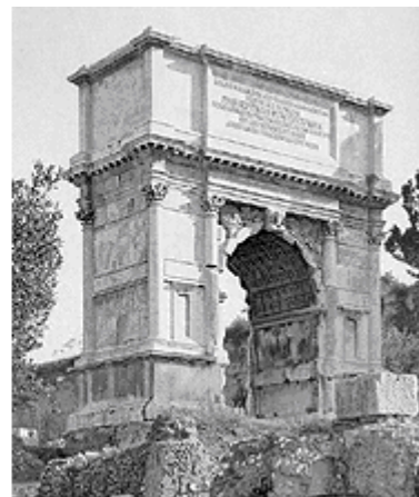
De Titusboog in Rome staat er nog steeds, na bijna 2000 jaar. Aan de binnenkant van de boog is er een afbeelding over de verwoesting van Jeruzalem door Titus en het wegdragen van de Tempelartefacts.

In 82 nC werd de Titusboog in Rome opgericht om de verwoesting van Jeruzalem te vieren. Hij werd gebouwd door keizer Domitianus ter ere van zijn oudere broer Titus, die het Romeinse 10 de Legioen had geleid tegen Jeruzalem en die nadien keizer werd. De triomfboog geeft Titus weer als “goddelijk”. Aan de binnenkant van de boog zijn er afbeeldingen van de artefacts uit de Tempel, met inbegrip van de menorah en de zilveren trompetten.