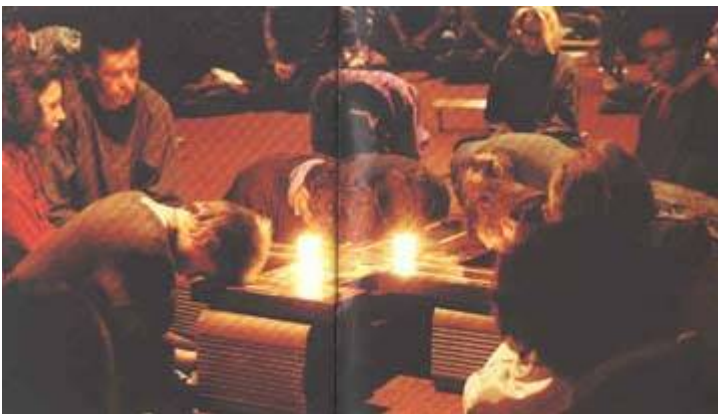
Vrijdagavondgebed - uit het boek “Taize, Trust on Earth”

Duizenden mensen per week maken een pelgrimage naar Taizé. Hieronder zijn Christenen, Joden, Boeddhisten en anderen.