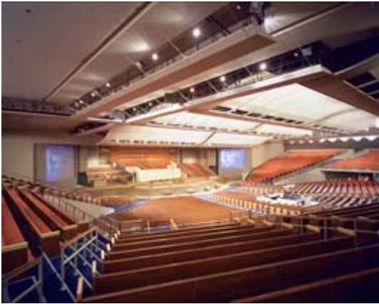
De "Potter's House" mega-kerk van T.D. Jakes

In dit kort artikel geef ik slechts een korte lijst uit de vele Oneness Pentecostal dwalingen. Voor meer gedetailleerde informatie kan de lezer op de link klikken aan het begin van dit artikel en terugblikken naar het excellente materiaal over deze sekte van CARM. [Of zie de links achteraan].