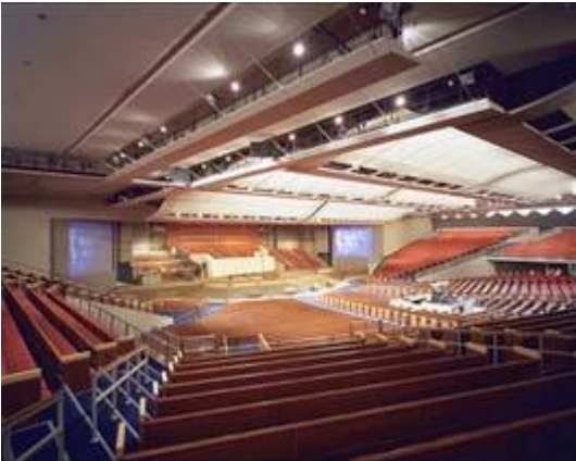
De "Potter's House" mega-kerk van T.D. Jakes

In dit kort artikel geef ik slechts een korte lijst uit de vele Oneness Pentecostal dwalingen. Voor meer gedetailleerde informatie kan de lezer op de link klikken aan het begin van dit artikel en terugblikken naar het excellente materiaal over deze sekte van CARM. [Of zie de links achteraan].