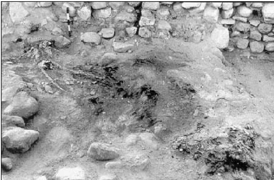
Twee slachtoffers van de verwoesting van Numeira (→ Gomorra) 3

Deze vijf steden situeerden zich allemaal langs de Dode Zee Scheur, een belangrijke breuklijn. Op Gods bevel barstte de breuklijn open en spuwde grote hoeveelheden vloeibare en gaseuze koolwaterstoffen hoog in de atmosfeer. Deze ontvlamden, zetten de hele regio in vuur en vlam en bedekten het met “vuur en zwavel”. Abraham zag deze grote brand vanuit Mamre (zie kaartje hogerop), enkele tientallen km daarvandaan. Het vurige mengsel kwam vrijwel zeker niet uit één punt, zoals een vulkaan, maar het verwoestte het hele gebied langs de lineaire breuklijn. De steden werden verwoest en verbrand net zoals de Bijbel het beschrijft. In de stad Sodom overleefde niemand. Vandaag blijven talloze lichamen opgesloten liggen in het puin.