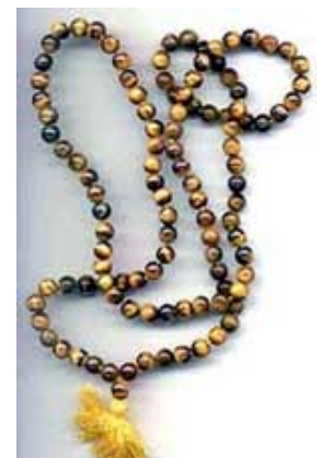
108 Kralen mala