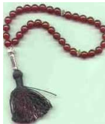
33 Kralen mala