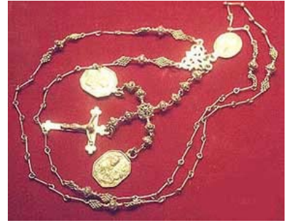
Hier wordt een rozenkrans "chotki" genoemd