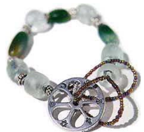
Heilig Wiel (Mandala) rozenkrans