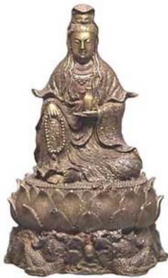
Kuan Yin met haar rozenkrans

“Godin van Genade” Kuan Yin vergeleken met haar versie van Rome