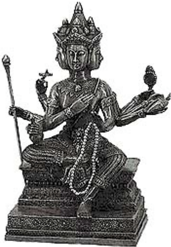
Brahma met mala