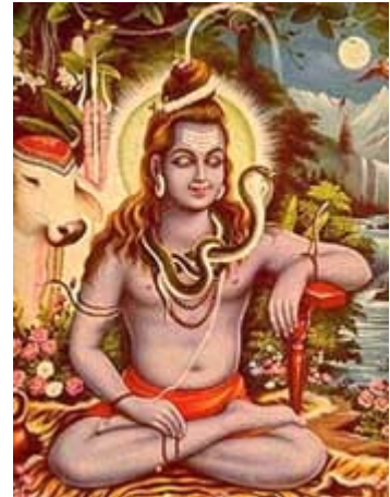
Shiva met mala in de hand