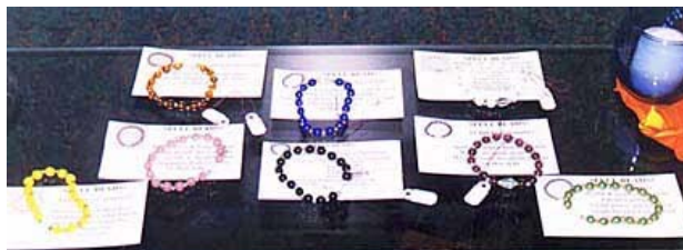
Rozenkransen voor de waarzeggerij