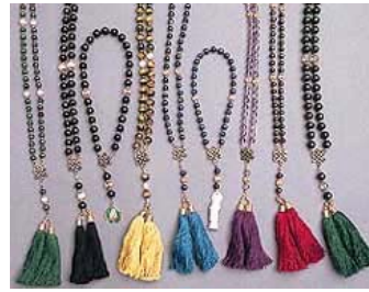
Verschillende types: 27, 54 en 108 kralen

“Godin van Genade” Kuan Yin vergeleken met haar versie van Rome