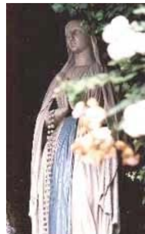
“OLV van Lourdes” met rozenkrans

Maria als ‘genadeschenkster’ had haar voorlopers: K/Q/Guan-Yin (Oost-Azië), Kannon en Yuki (Japan), Kwun-Yam, enz. - zij worden allen ‘Godin van de Genade’ genoemd.