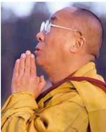
Dalai Lama (Tibet)