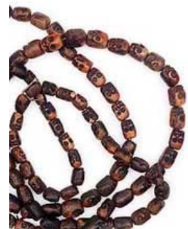
Met doodskoppen, gemaakt uit de doodsbeenderen van ‘heilige’ mannen of lama’s