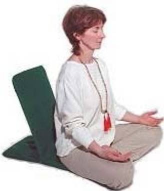
Mala die gebruikt wordt bij de Yogabeoefening