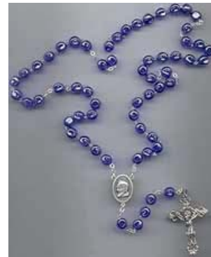
Pater Pio rozenkrans