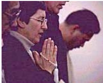
Boeddhistisch gebed met rozenkrans