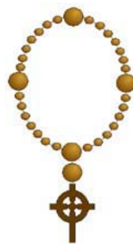
Klassiek model van een Anglicaanse “rosary”