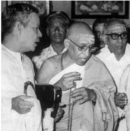
Bij de Hindoes wordt een rozenkrans "mala" genoemd.