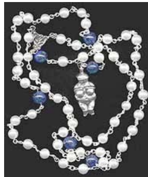
“Onze Moeder” rozenkrans