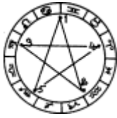
Pentagram met zodiak

Wicca, Satanskerk en Vrijmetselarij, die tamelijk recente stromingen lijken te zijn maar in feite zeer oude duivelse wortels hebben in Mesopotamië.