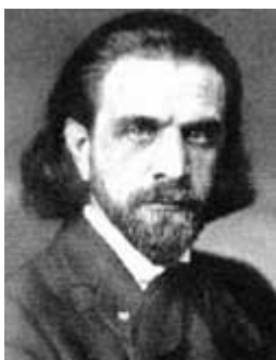
Bartlett Joshua Palmer

Bartlett geloofde dat hij de theorie van chiropraxie ontvangen had van God. Hij schreef: