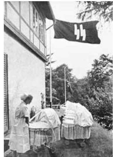
Figuur 2. Het Lebensborn programma in actie

Om ten gronde te begrijpen wat Hitler echt dacht over het Christendom, moet men onderzoeken wat hij privé zei tot zijn stafleden. Alan Bullock citeert Hitler als dat hij christenen “vuile reptielen” noemt die gebruik maken van Duitslands zwakte, en dat zij door Joden uitgevonden sprookjes imiteren (p. 303). Historicus George Constable wijst erop dat Hitler privé zei dat hij uiteindelijk het Christendom in Duitsland zou willen uitroeien, met “wortel en tak” (pp. 13–14). Hitler zij eens: “Ikzelf ben een heiden tot in de kern” (p. 57). Tot zover de mythe dat Hitler op enige manier, gedaante of vorm een christen was.