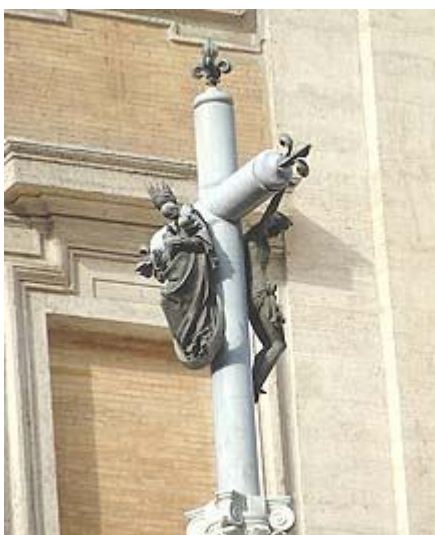
Maria op het kruis met Christus, Santa Maria Maggiore, Rome.

En er is ook een prominent beeld van Maria met de titel “Maria, Koningin van Vrede” (hierboven).