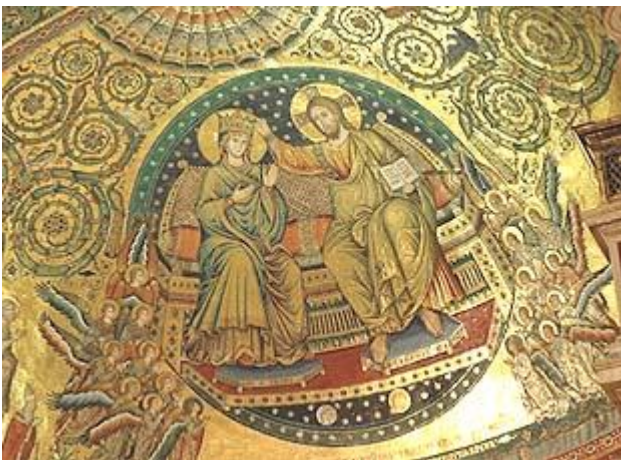
Maria gekroond tot Koningin des Hemels, Santa Maria Maggiore, Rome.

Bij een van zijn eerste handelingen als “pontifex” bezocht paus Franciscus de Basiliek van Santa Maria Maggiore 1 en hij “bad tot de maagd voor de bewaring van allen in Rome” (“New Pope Francis Visits St. Mary Major”, Vatican Information Service, 14-3-2013). In de basiliek “bracht de paus de maagd een boeket bloemen” en bad ongeveer 10 minuten tot haar. Santa Maria is een van de vier “patriarchale basilieken”, wat betekent dat zij direct geassocieerd zijn met de paus en dat ze pauselijke altaren hebben; nergens is de diepe afvalligheid van de Rooms-katholieke kerk meer evident. Gebouwd in ong. 350 werd ze gerestaureerd door paus Sixtus III als herdenking van de verklaring van Maria’s Goddelijke Moederschap door het Concilie van Efeze in 432, welke verklaarde: “Maria was de Moeder van één Persoon, en omdat hij zowel God was als mens, wordt zij terecht Moeder van God genoemd”. De mozaïek in de apsis beeldt Maria af als zittend aan de rechterhand van Jezus op zijn troon en door hem gekroond als Koningin des Hemels (zie hieronder links).