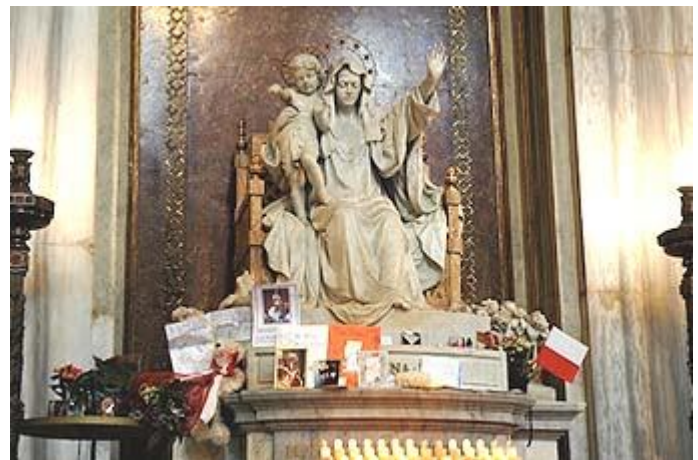
Maria, Koningin van Vrede, Santa Maria Maggiore, Rome.

En er is ook een prominent beeld van Maria met de titel “Maria, Koningin van Vrede” (hierboven).