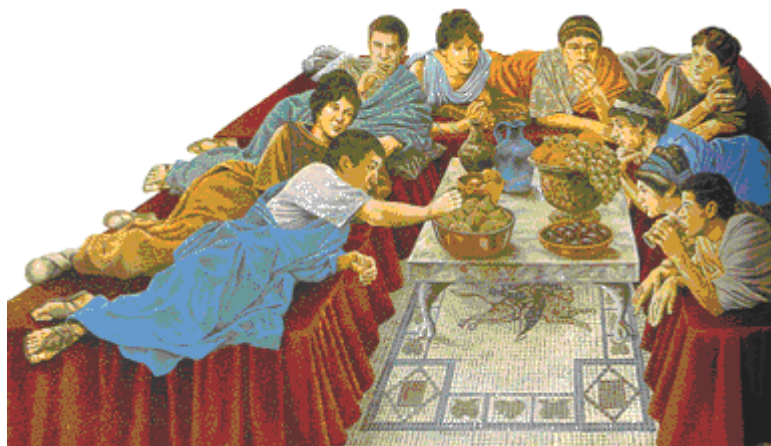
Zo lag men in Romeinse tijden aan aan tafel

Johannes is gekend als “de discipel die Jezus liefhad”. We lezen van hem in Johannes 13:23 (denk eraan, hij is ook de man die dit Evangelie schreef). Johannes lag in de schoot van Jezus. In bijbelse tijden zaten de mensen niet op stoelen aan tafel. Zij leunden op hun zij op sofa's, rustend op hun linker elleboog en met de rechterhand vrij om te eten. Zij lagen dus op hun zijde. Het hoofd was het dichtst bij de tafel en de voeten het meest weg van de tafel. De persoon aan zijn rechterzijde zou het hoofd nabij de borst hebben van de eerste persoon. Johannes lag aan de rechterkant van Jezus.