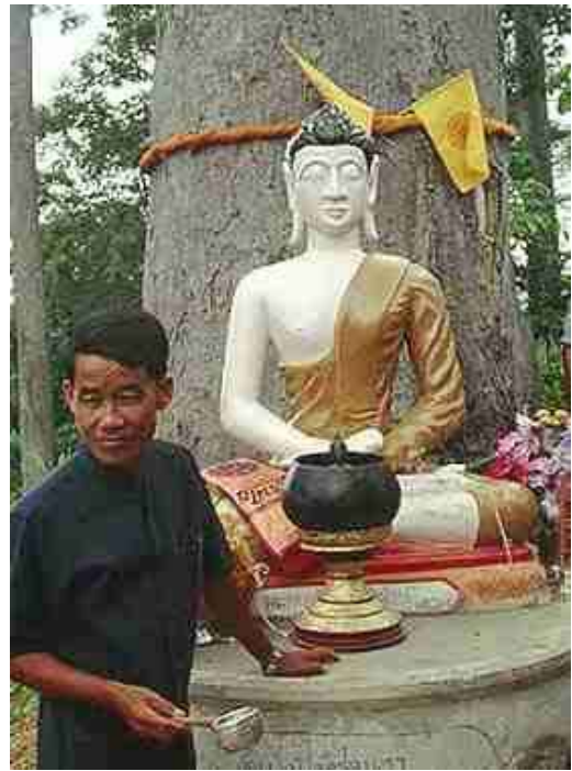
Heilig water drinken bij een gelofte in de Nan Provincie, Thailand