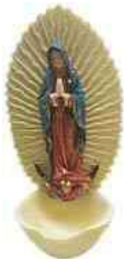
Met de Madonna van Guadeloupe

Hier wordt wijwater in gedaan. De vingers worden daarin nat gemaakt om een kruisteken te maken.