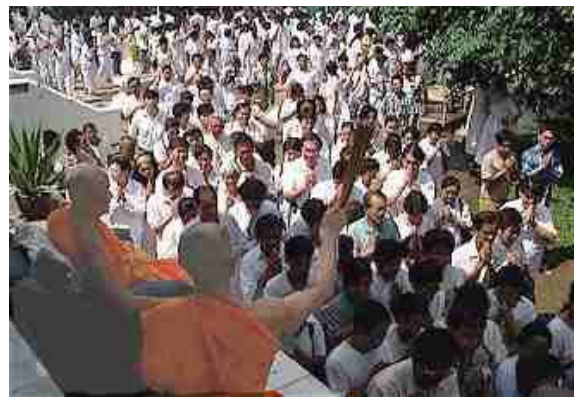
Sprenkeling van heilig water in Thailand (puja)