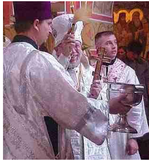
Ook Orthodoxe kerken zijn niet zuinig met het sprenkelen van heilig water