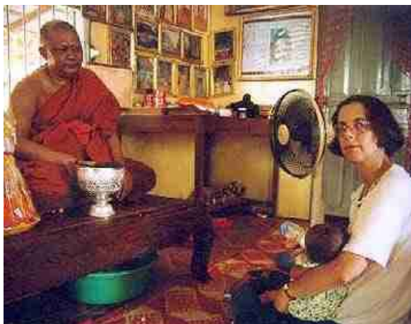
In Cambodja wordt deze moeder gezegend