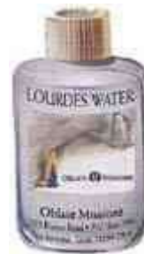
Heilig water van Lourdes