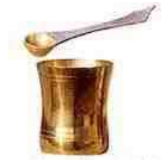
Rechts hetzelfde maar dan voor gebruik in het Hindoeïsme

Heilig water sprenkelen/drinken/inwrijven is een gebruik dat door de Roomse kerk, en haar Orthodoxe broeders, gekopieerd en geadopteerd werd van het aloude afgodische heidendom. Tegenwoordig nog steeds in gebruik bij o.a. Boeddhisten en Hindoes, zoals de beelden hierna bewijzen.