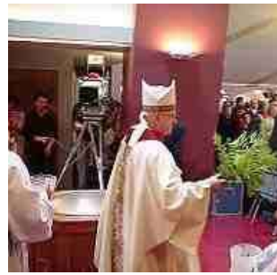
Met bladertakken, kwast of sprenkelaar ...