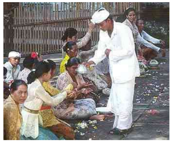
Tempelfeest op Bali: heilig water sprenkeling