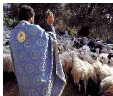
Wijwater kan ook over de schapen ge- sprekeld worden