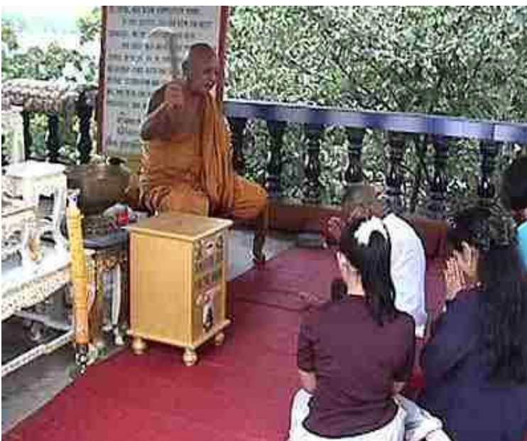
Deze boeddhistische priesters sprenkelen heilig water over zijn adepten, vanuit een koperen bekken.

Heilig water sprenkelen/drinken/inwrijven is een gebruik dat door de Roomse kerk, en haar Orthodoxe broeders, gekopieerd en geadopteerd werd van het aloude afgodische heidendom. Tegenwoordig nog steeds in gebruik bij o.a. Boeddhisten en Hindoes, zoals de beelden hierna bewijzen.