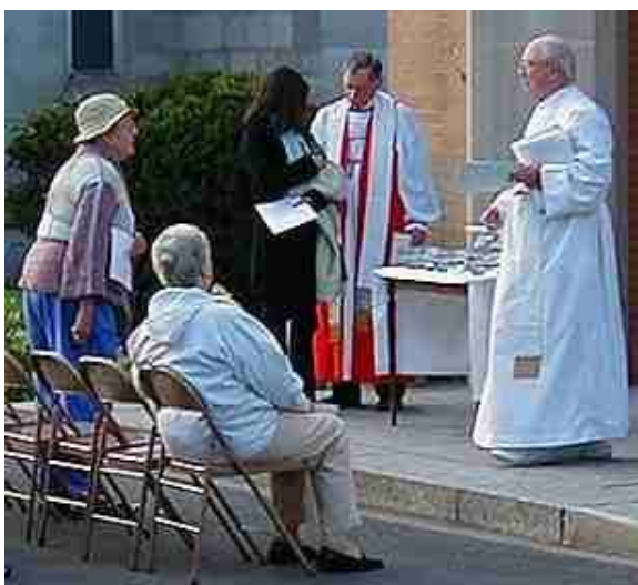
Wijwaterzegening van kleine huisdieren