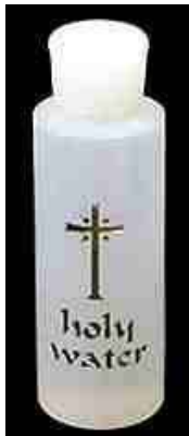
Kleine fles heilig water