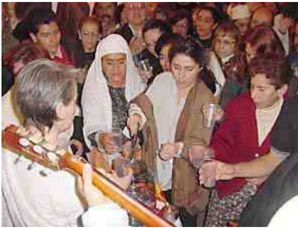
Gezamenlijk heilig water drinken tijdens de Intergeloof gebedssamenkomst voor wereldvrede op 27 Oktober 2001, in Mexico-stad