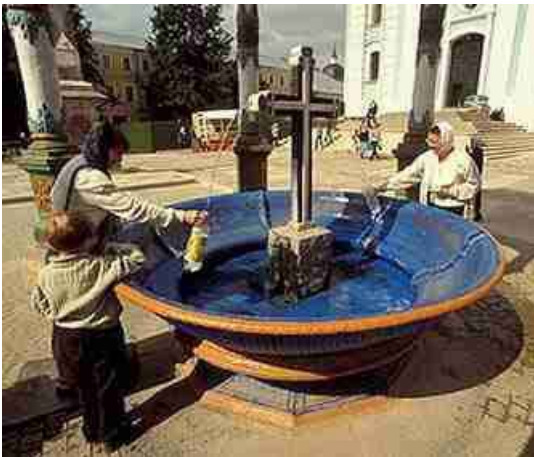
Links: heilig water loopt weerskanten uit een kruis, bij het Orthodoxe klooster van Sergiev, Posad-Rusland ... kwestie van flessen vullen om je verworven 'zegening' en 'heiliging' mee naar huis nemen ... maar je kan het ook ter plaatse drinken - kopie en adoptie van de heidense cultus!