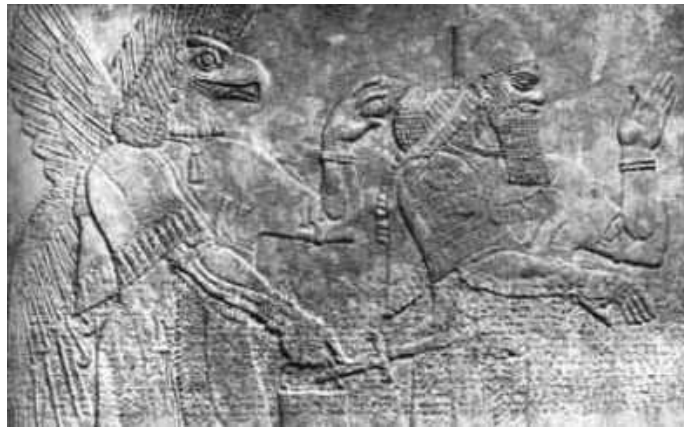
Sumerische god sprenkelt heilig water