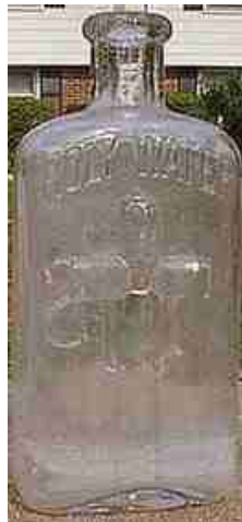
Oude fles voor 'Holy Water'