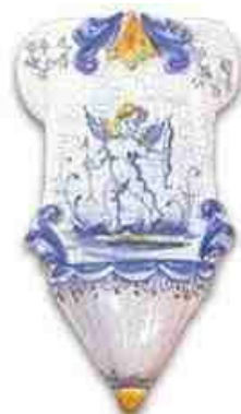
Zelfs met Cupido!