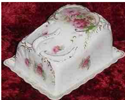
Gewoon mooi versierd