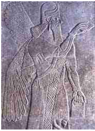
Gevleugelde Assyrische god sprenkelt heilig water