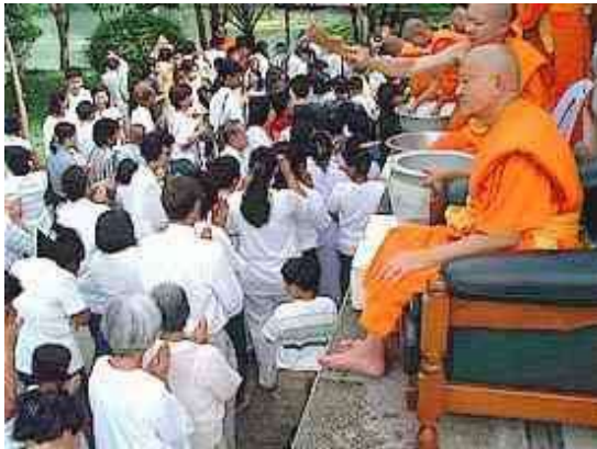
Heilig water sprenkeling bij Boeddhisten