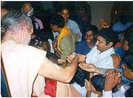
Heilig water uit een lepeltje bij Hindoes