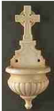
Met een Heidens-Keltisch zonnegodkruis