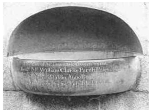
Bij de ingang van elke kerk