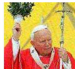
Ook de paus sprenkelt gewijd water

En vanalles-en-nog-wat wordt er besprenkeld door de zogenaamde 'christelijke' kerken