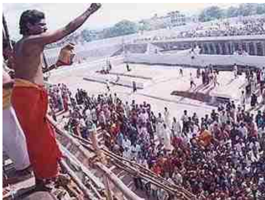
Heilig water wordt over Hindoes gesprekeld