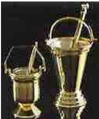
Links een paar containertjes met sprenkelaars voor het gebruik van heilig water in de Roomse ritus