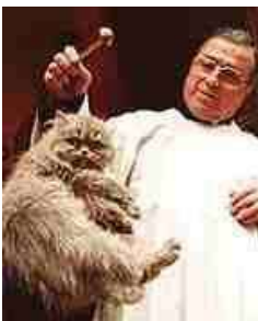
Hier wordt een kat besprenkeld