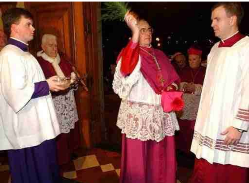
Een bisschop sprenkelt gewijd water.