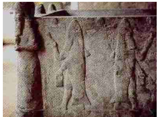
Hier een stenen bassin uit Assyrië dat zich bevindt in het Pergamummuseum in Berlijn. Op de zijden zijn Dagonpriesters uitgebeeld die een grote vis dragen als een soort cape ... en die heilig water sprenkelen.