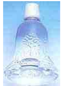
Heilig water van Fatima