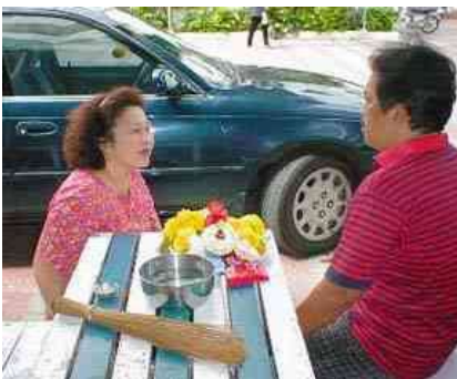
Brahman wijdt een auto