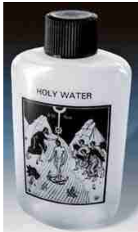
Grote fles heilig water