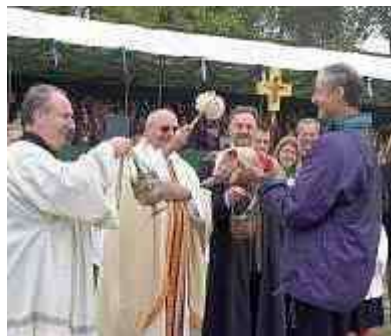
Hierboven een varkentje Rechts de hondjes