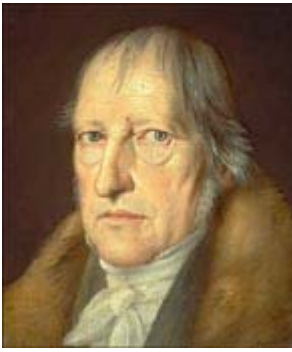
Georg Wilhelm Friedrich Hegel 1770-1831