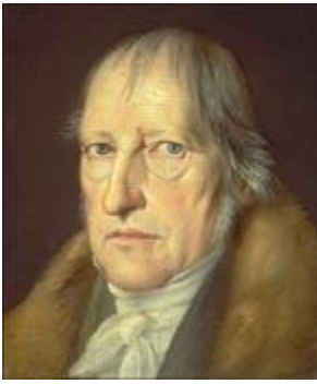
Georg Wilhelm Friedrich Hegel 1770-1831