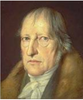
Georg Wilhelm Friedrich Hegel 1770-1831