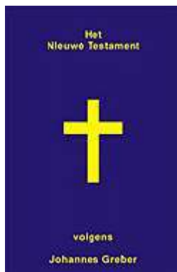
Nog steeds verkrijgbaar 3