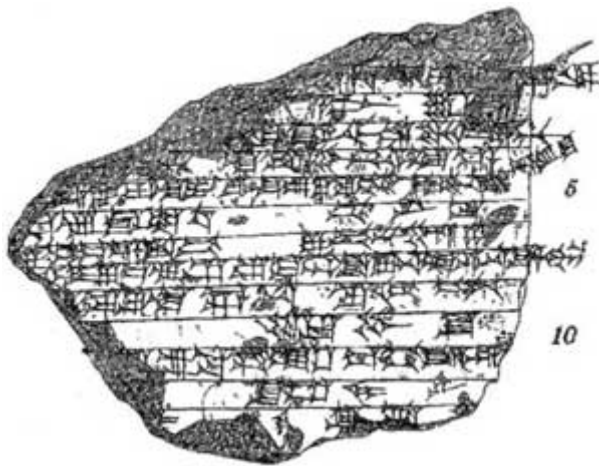
Figuur 1. Tabletfragment uit de Tempelbibliotheek van de oude Sumerische stad Nippur (ca. 2100 v.C.) Ontdekt door de Universiteit van Pennsylvania en vertaald door Hermann Hilprecht: het verslag komt overeen met Genesis in elk detail.

Een alternatieve verklaring voor de overeenkomsten, uiteraard, is dat het epos één van de vele verslagen is over de Vloed die later door nakomelingen van Noach doorgegeven werden aan hun afstammelingen en vastgehouden werden in de culturen van de snel groeiende naties als gevolg van de verspreiding van de mensheid vanaf Babel.