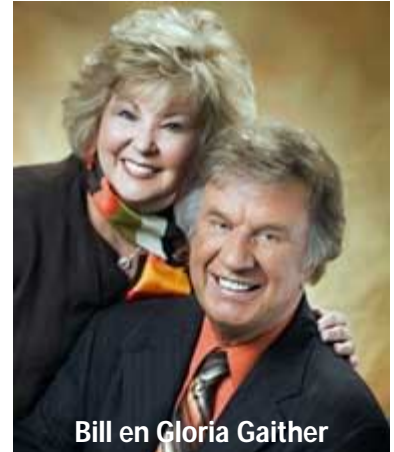
Bill en Gloria Gaither