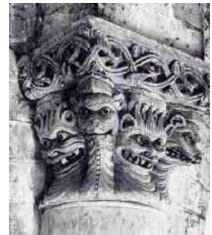
Rechts demonenkoppen, in Cunault, Frankrijk

Hierna nog enkele rare snuiters op de Notre-Dame van Reims: