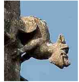
Hieronder een spuiër op de St. John the Baptist Church te Pilton, Somerset.