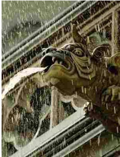
Washington National Cathedral