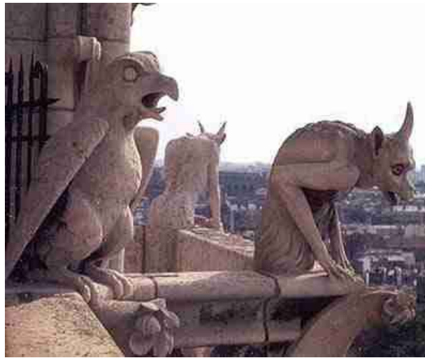
Links: demonen op de Notre-Dame van Parijs.