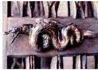
Winged Serpent Door Handle St. Mary's Cathedral San Francisco

Niet alleen een draak, ook een uitbeelding van een demon of veldgeest is te zien in de schatkamer van de Sint-Pietersbasiliek te Rome (Links).