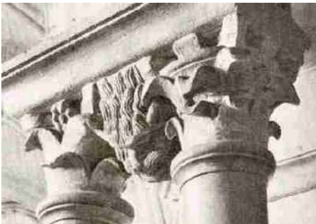
Links een monster tussen de pilaren, in de kathedraal te Langres, Frankrijk (gewijd 1196).