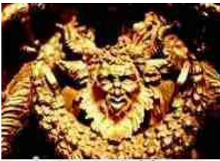
Nature Spirit on Sacres Reliquary Vatican Treasury, St. Peter's Basilica

Niet alleen een draak, ook een uitbeelding van een demon of veldgeest is te zien in de schatkamer van de Sint-Pietersbasiliek te Rome (Links).