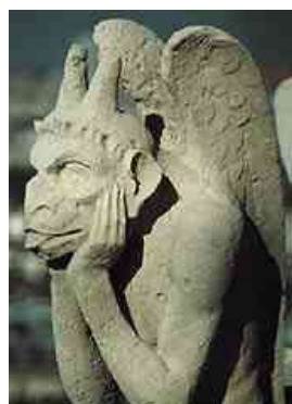
Deze duivel steekt zijn tong uit, Parijs, Notre-Dame