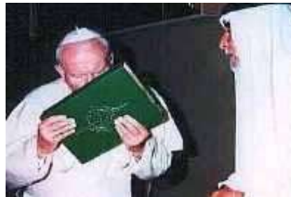
De paus kust de Koran : Satan heerst !

Links een gevleugelde draak bovenop de torenspits van Saint Mary-Le-Bow in London, met rechts een detail. De alles overstijgende symboliek hiervan is duidelijk: Satan heerst in de Kerk, van oudsher met allerlei afgoederijen, en tegenwoordig door de oecumenische geest die alle afval bij elkaar tot één algemene Kerk van de afval moet brouwen :