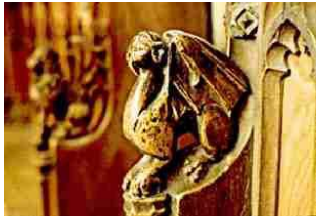
Boven een gevleugelde draak in het interieur van de Saint Peters Church in Walpole.

Links: draak tegen preekstoel (anno 1807) in Franse kerk