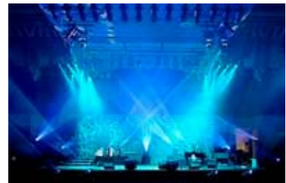
Warrens Saddleback megakerk

Wilkinson zei tot de Saddlebackvergadering en zijn internetpubliek dat iedereen een “persoonlijke Droom” heeft. Hij stelde dat het hele gebied van iemands “persoonlijke Droom” iets was dat “nodig opnieuw tot leven moet gebracht worden in de hele wereld”. Hij zei: “mensen moeten hun Droom kennen” en mensen moeten naar “hun Droom leven”. Hij zei: “iedereen heeft een Droom” in zijn hart, en ook dat deze Droom hun “bestemming” is. Hij vertelde hen dat de reden dat zij die Droom hebben is dat God deze Droom in hun hart heeft gelegd.