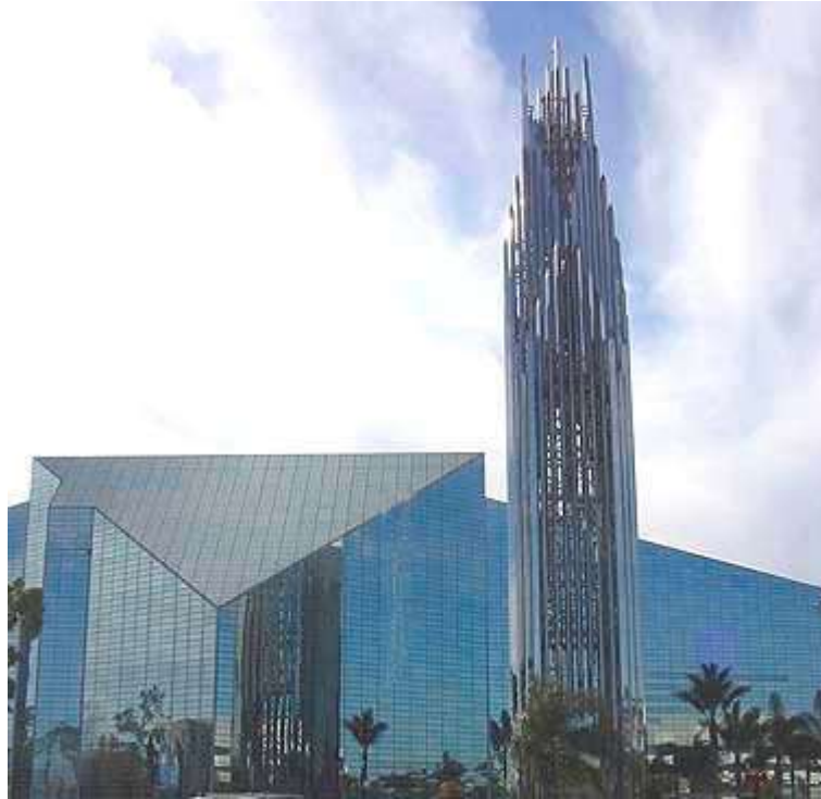
De Crystal Cathedral