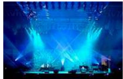
Warrens Saddleback megakerk