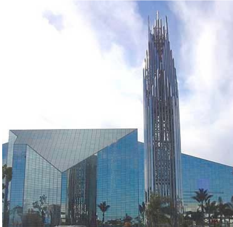
De Crystal Cathedral

In een 1994-radiouitzending had ik gebruik gemaakt van de associatie van de Crystal Cathedral met Jerry Jampolsky en A Course in Miracles , als een voorbeeld van hoe New Age leringen de Kerk begonnen binnen te sluipen, in de vroege jaren 1980. Het schetste de bedrieglijke leringen van A Course in Miracles en besprak hoe de niet onderscheidende Schuller de New Age leider Jampolsky opvoerde in zijn Hour of Power televisieprogramma. 21 Ik was er me ook van bewust dat Course in Miracles studiegroepen samengekomen waren op het terrein van de Crystal Cathedral, en dat de Cathedral stafmedewerkers geïnteresseerden naar een lokale Course in Miracles distributiecentrum stuurden om exemplaren te kopen van A Course in Miracles .