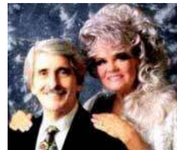
Paul & Jan Crouch

► CCC heeft ook een alliantie gesmeed met het godslasterlijke, charismatische Trinity Broadcasting Network (TBN), in eigendom van en geleid door Paul en Jan Crouch. De TBN-nieuwsbrief stelt: “Het opwindende nieuws is dat Dr. Bill Bright van Campus Crusade for Christ een team gestationeerd heeft in El Salvador, gereed voor de productie van Spaanstalige christelijke programma’s. Zij HOUDEN VAN de gezalfde Divine Healing diensten daar. Het Lichaam van Christus komt samen in El Salvador -- niet-katholieken en katholieken HOUDEN VAN christelijke Tv en mensen van overal in El Salvador komen tot Jezus!” (Verslag in de Calvary Contender , 15-2-1991).