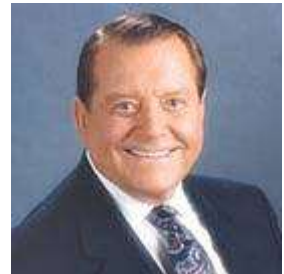
Bill Bright, 1921-2003