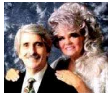
Paul & Jan Crouch

► CCC heeft ook een alliantie gesmeed met het godslasterlijke, charismatische Trinity Broadcasting Network (TBN), in eigendom van en geleid door Paul en Jan Crouch. De TBN-nieuwsbrief stelt: “Het opwindende nieuws is dat Dr. Bill Bright van Campus Crusade for Christ een team gestationeerd heeft in El Salvador, gereed voor de productie van Spaanstalige christelijke programma’s. Zij HOUDEN VAN de gezalfde Divine Healing diensten daar. Het Lichaam van Christus komt samen in El Salvador -- niet-katholieken en katholieken HOUDEN VAN christelijke Tv en mensen van overal in El Salvador komen tot Jezus!” (Verslag in de Calvary Contender , 15-2-1991).