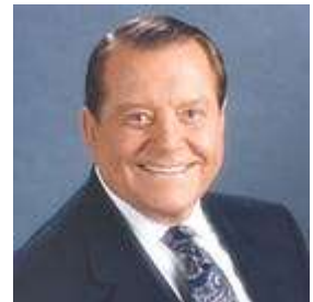
Bill Bright, 1921-2003