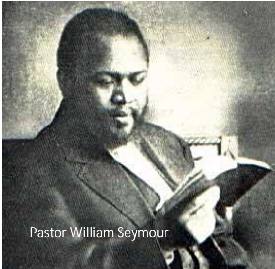
Pastor William Seymour

Een van de studenten van Parhams Houston Bible school was William J. Seymour (1870-1922), een zwarte evangelist die Parhams doctrine aannam en het meebracht naar Los Angeles, Californië.